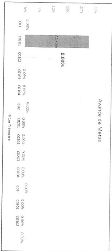
Gráfica 3. Avance de Metas

Fuente de información: Matriz de indicadores para resultados 1er trimestre 2026