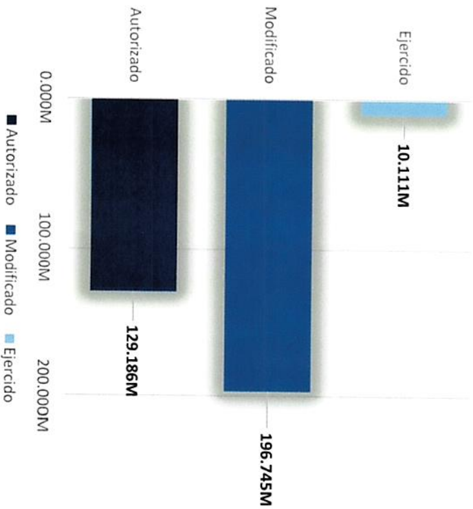
Gráfica 1. Evolución del presupuesto del Pp.

El Programa Presupuestario se encuentra alineado al Plan Nacional de Desarrollo 2019 – 2024 específicamente en el ámbito del Desarrollo Sostenible. Asimismo, su alineación con el Plan Estatal de Desarrollo 2022 – 2027, dentro del eje Desarrollo Humano, particularmente en Salud, Desarrollo Humano e Identidad Chihuahua, el cual busca contribuir al desarrollo integral de las personas en condiciones de vulnerabilidad. El objetivo fundamental de estos Programas de mediano plazo “Desarrollo de oportunidades para disminuir la pobreza”.