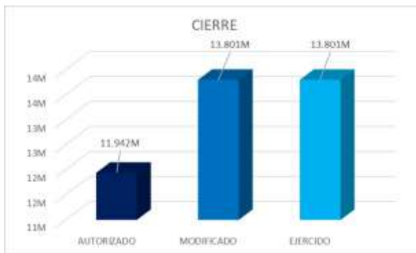
Gráfica 1. Evolución del presupuesto del pp.

M=Millones de pesos