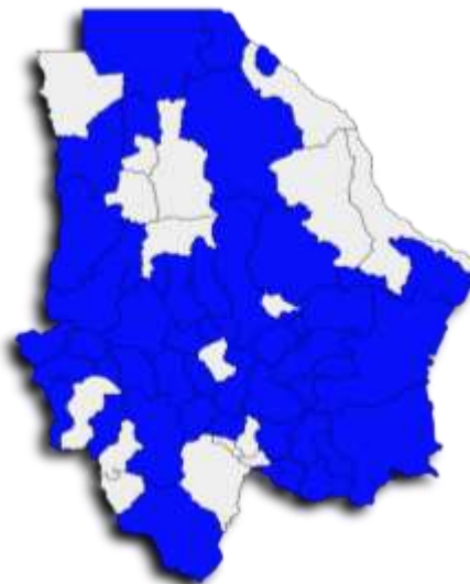
Gráfica 2. Avance de Población Atendida

Según el seguimiento por municipio, la cobertura atendida hasta el cuarto trimestre abarca 41 municipios del Estado de Chihuahua.