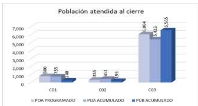
Gráfica 2. Avance de Población Atendida.

Fuente de información: Programa Operativo Anual y Padrón Único de Beneficiarios 2023 cierre.