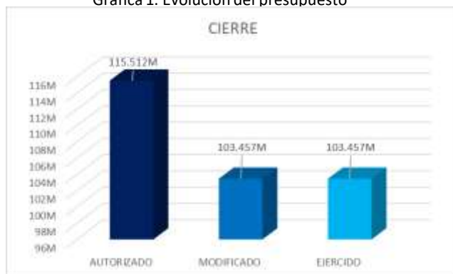
Gráfica 1. Evolución del presupuesto

Fuente de información: Matriz de Indicadores para Resultados cierre 2023 *M=Millones de pesos