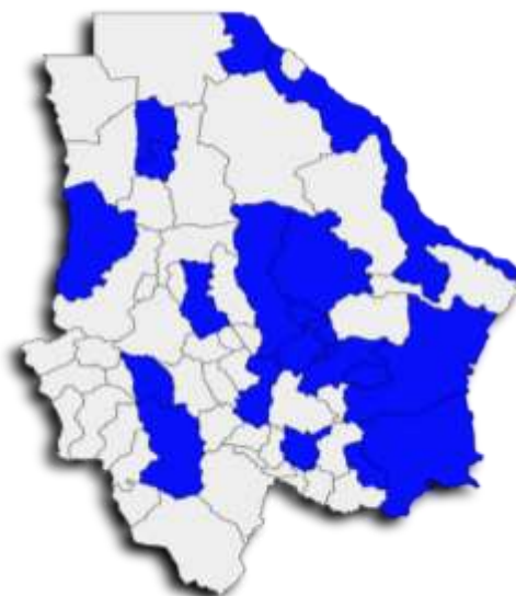
Gráfica 2. Avance de Población Atendida

Según el seguimiento por municipios, la cobertura del programa abarca al cierre del ejercicio, las localidades de Aldama, Aquiles Serdán, Bocoyna, Camargo, Chihuahua, Cuauhtémoc, Delicias, Galeana, Guachochi, Guadalupe, Hidalgo del Parral, Jiménez, Juárez, La Cruz, López, Madera, Meoqui, Nuevo Casas Grandes, Ojinaga, Rosales, Satevó y Saucillo.