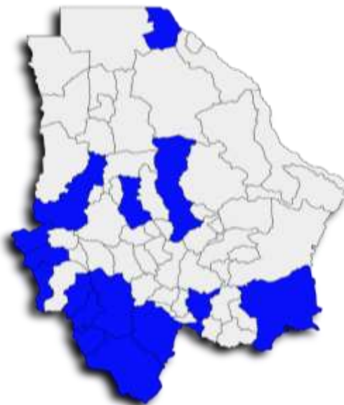
Gráfica 2. Avance de Población Atendida

De acuerdo al seguimiento por municipio, la cobertura atendida hasta al cierre del año, abarca los municipios Balleza, Batopilas de Manuel Gómez Morín, Bocoyna, Chihuahua, Chínipas, Cuauhtémoc, Guachochi, Guadalupe y Calvo, Hidalgo del Parral, Jiménez, Juárez, Morelos, Moris, Santa Bárbara, Temósachic, Urique y Uruachi.