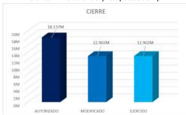
Gráfica 1. Evolución del presupuesto del Pp.

Fuente de información: Matriz de Indicadores para Resultados 2023 3er trimestre *M=Millones de pesos