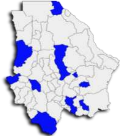
Gráfica 2. Población Atendida

De acuerdo al seguimiento por municipio, la cobertura atendida al cierre abarca los municipios de Bocoyna, Chihuahua, Guachochi, Guadalupe y Calvo, Hidalgo del Parral, Juárez, La Cruz López, Madera, Matamoros, Mecoqui, Moris, Urique y Uruachi.