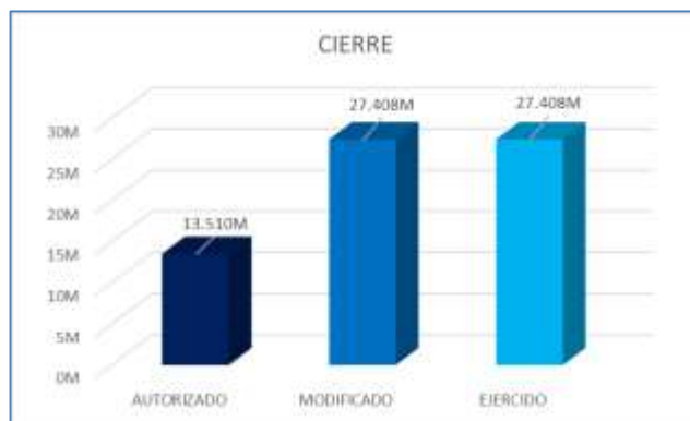
Gráfica1. Evolución del Presupuesto del Programa

Fuente de información: Matriz de indicadores para resultados cierre 2023 *M=Millones de pesos